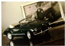
Une nature morte sentimentale. "La photo montre une Karmann Ghia. Mon père possédait une telle voiture de sport légendaire, et pouvoir s'y installer comme enfant était un véritable événement. Je m'en tiens à un modèle réduit."

L'extension a été réalisée par Mi Casa, un entrepreneur spécialisé dans la construction exclusive en bois massif. Le prolongement de l'axe de la cuisine et de la salle à manger crée une grande ouverture. L'agréable couloir qui mène vers le garage est placé sous le signe de la chasse. Il y fait délicieusement souffler quelques instants sur un banc entre les petits oliviers et les buis. Mais c'est surtout l'orangerie, la partie principale de l'extension, qui constitue une plus-value énorme. Toutes les fenêtres peuvent s'ouvrir. Été et hiver, le jardin parc avec piscine et terrasses vous séduit, et