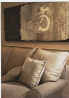
Un peintre espagnol a greffé cette toile sur le séjour.