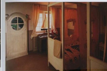
C'est toujours la récréation dans la chambre d'enfants.

Le soir venu, l'éclairage de jardin de Marcotte Style enveloppe les arbres, plantes et buissons d'un halo magique. Jour et nuit, vous pouvez y observer le va-et-vient des lapins, oiseaux, écureuils... Les parois en bois, la faïte, la décoration de fenêtre et les sofas ont été maintenus blancs à dessin. Deux lampadaires avec abat-jour géométrique de teinte anthracite montés sur des faisceaux de bois flottant flanquent le coin-salon. L'antique cheval à bascule est une pièce de famille. Au mur est accroché un ornement encadré qui attire les regards. Une tapisserie et un dressoir italien du XVIII e siècle avec une marqueterie précieuse créent un tableau assorti.