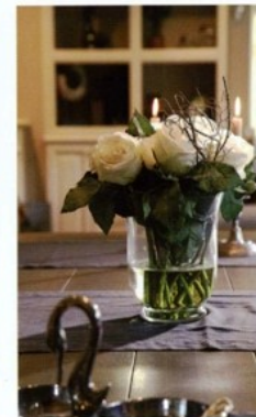
Les fleurs artificielles semblent vivantes.