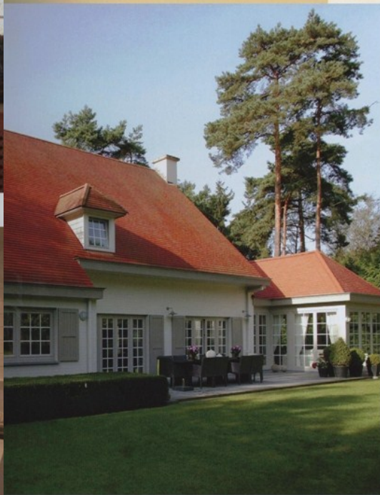
Le soleil accentue la rouge feu des tuiles plates de Koramic.