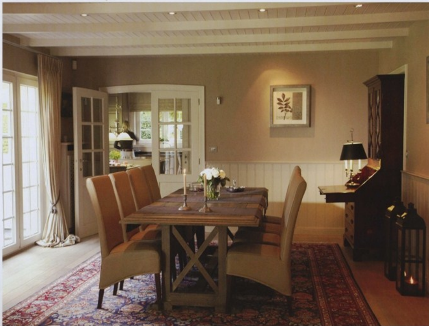
La couleur des rideaux de la salle à manger est reprise dans les stores de la cuisine, mais avec une rayure.