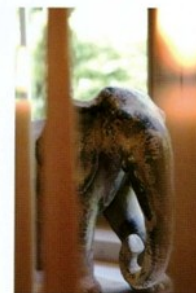
Les détails personnels confèrent à l'ensemble un cachet additionnel.

La pièce de télévision a été peinte ton sur ton en trois nuances. Le téléviseur est dissimulé dans une armoire des boiseries. Sur la tablette de fenêtre, un éléphant qui a été vieilli en Indonésie par un procédé laborieux.