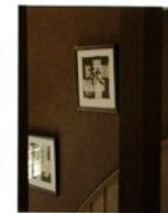
Des lithas chinoises avec pour thème les quatre saisons ornent l'escalier. Sur le palier, un bureau avec une histoire a reçu une petite place.