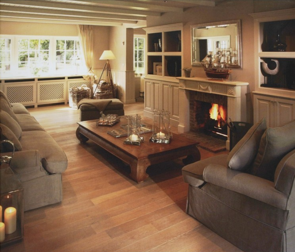
Près d'une fenêtre avec des draperies à trainée trônent des paniers et un curieux lampadaire réalisé avec un statif d'arpenteur.