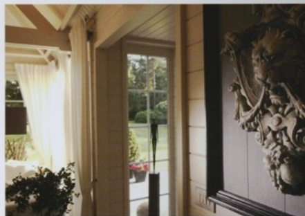
Un ornement encadré attire les regards.