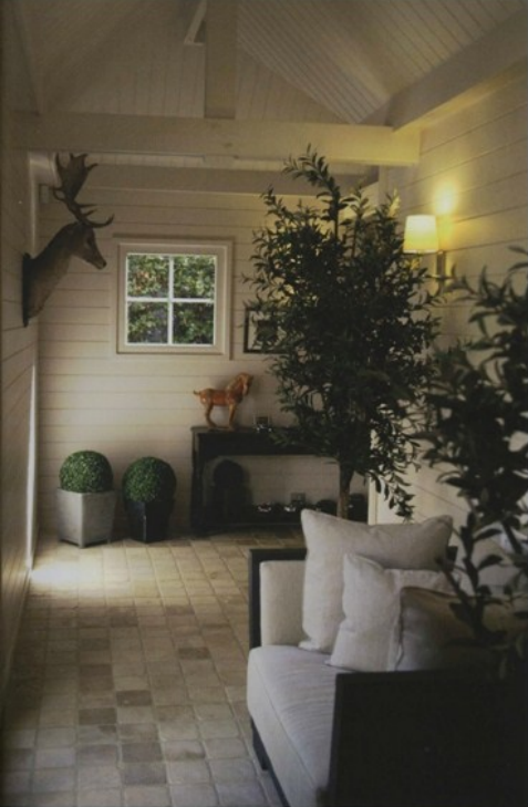
L'extension exclusive a été construite par Mi Casa en bois massif.